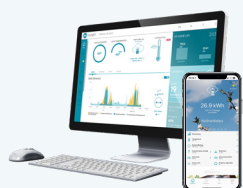
Suite logiciel MyLight Systems